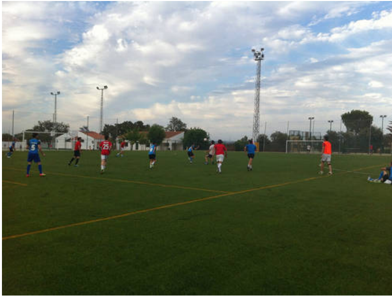
( http://www.portalayto.diphuelva.es/export/sites/diputacion-huelva-semilla/es/.galleries/imagenes-noticias/13e374d794.jpg )