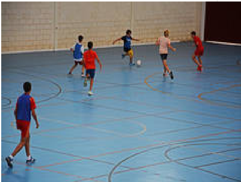
( http://www.portalayto.diphuelva.es/export/sites/diputacion-huelva-semilla/es/.galleries/imagenes-noticias/7d19fb985f.jpg )